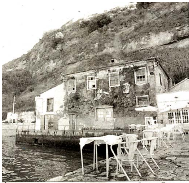
ÚLTIMA DERROCADA CRIOU NUVEM DE PÓ NA ZONA DE OLHO DE BOI

Correio da Manhã 9/1/2007 (JOÃO SARAMAGO)